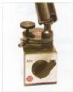
Drehbare Feineinstellung mit Magnet